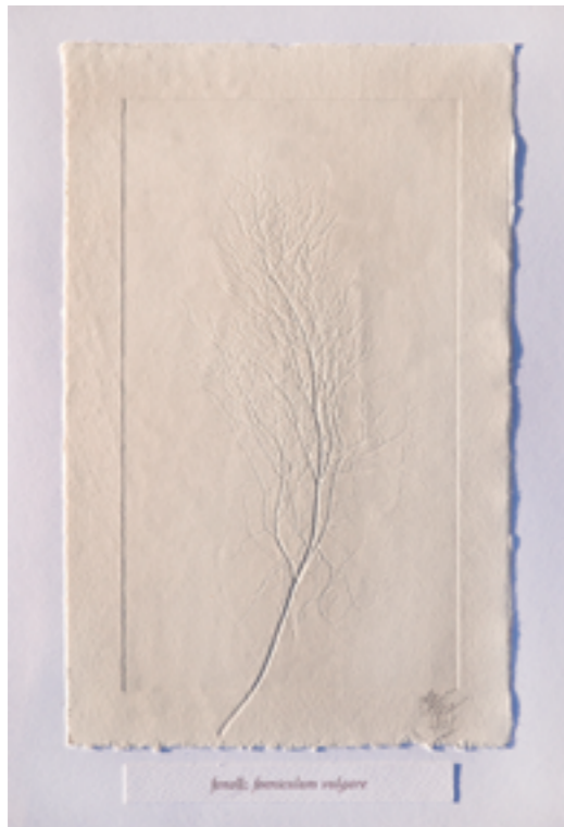
junell: junceus vulgaris