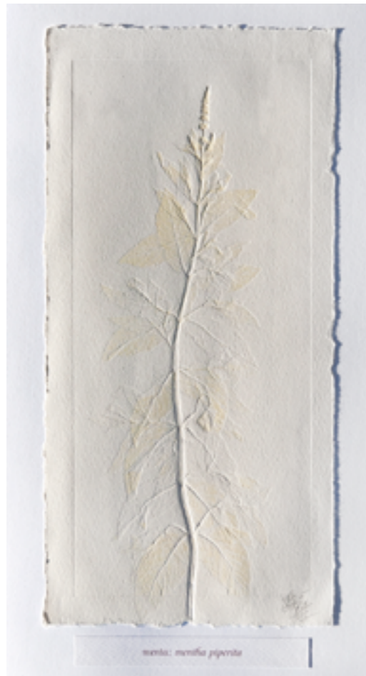
menta: mentha piperita