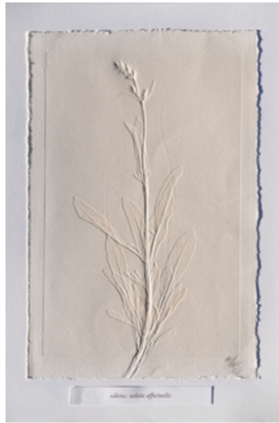
salix: salix affinis