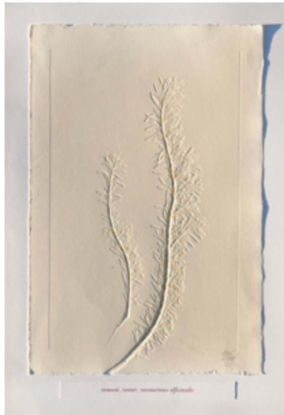
rosari, rosari, rosari affinis